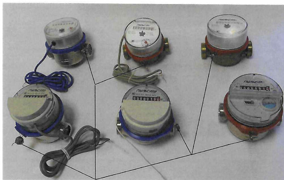
Место пломбирования и нанесения знака поверки

Знак поверки наносится на пломбу и на руководство по эксплуатации для исполнений счетчиков, приведенных на рисунке 2.